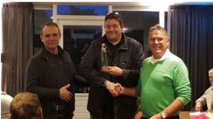
Het team "Bij Ons" winnaar Bussinescompetitie 2019