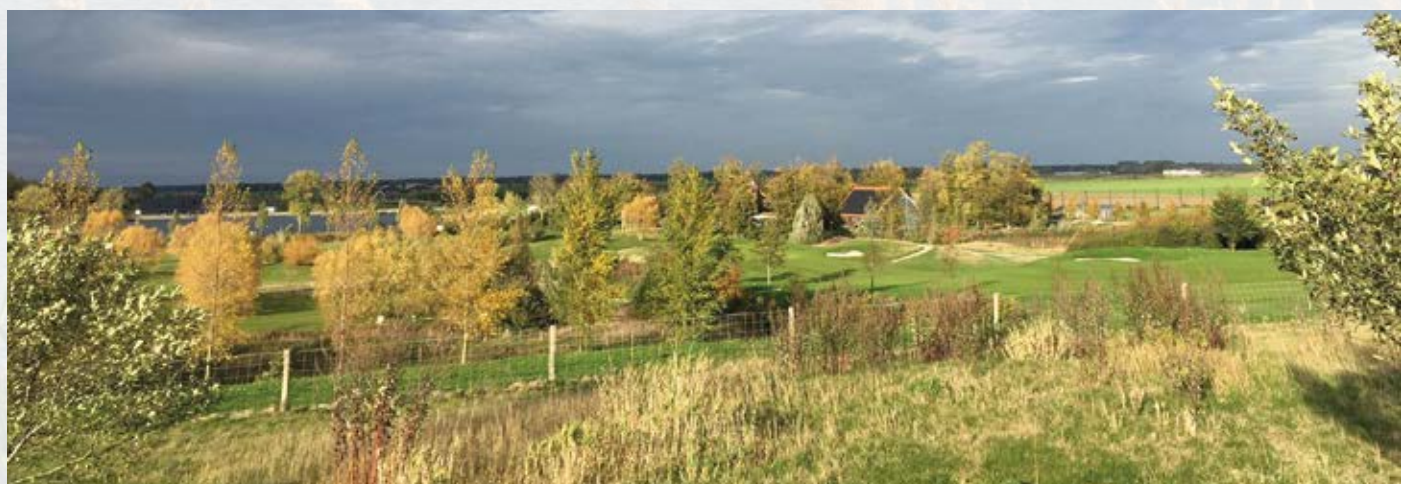
Mooie najaarsfoto van de baan, met dank aan Greet Geerts