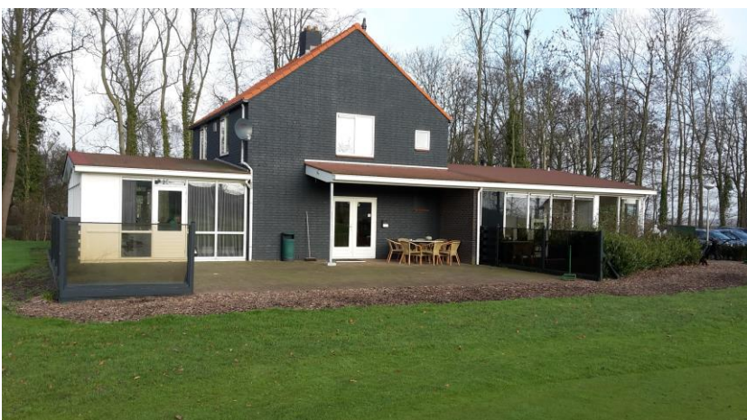
Zo was het eind januari 2016.