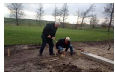
Nog heel veel te doen.